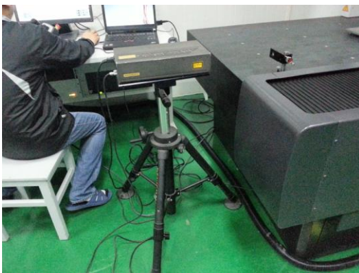
全部採用雷射準值儀調試